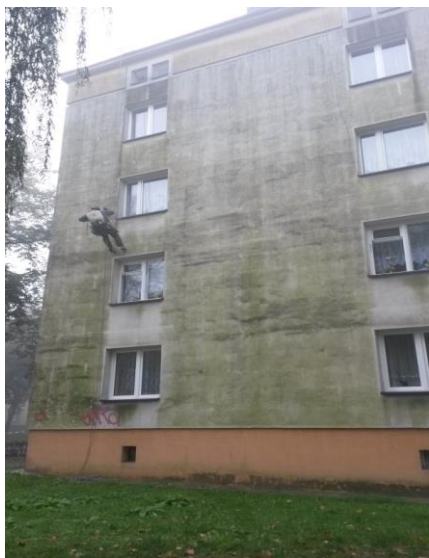
Budova s biokoróziou