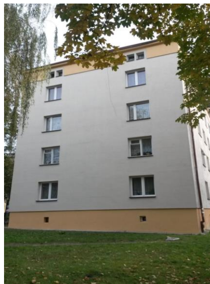
Po aplikácii BOLIX COMPLEX